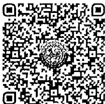
QR Code แบบรายงาน